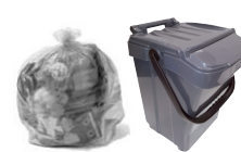
MATERIALI NON RICICLABILI

NO: Carta o cartone sporchi di cibo o di altre sostanze, carta oleata o plastificata, piatti e bicchieri di plastica, buste o sacchetti di plastica.