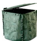
SCARTI ALIMENTARI E ORGANICI