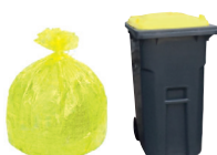
IMBALLAGGI IN PLASTICA

NO: Bicchieri, vetroceramiche e pirofile, ceramiche e porcellane, cristallo, lampadine e lampade al neon, contenitori per solventi.