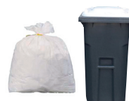
CARTA, CARTONE E CARTONCINO

NO: Oggetti in plastica e gomma: giocattoli posate di plastica usa e getta, penne, pennarelli, spazzolini, cassette e DVD.