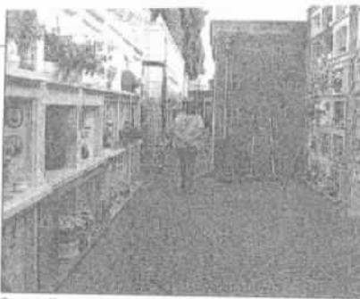
Sempre più emergenza nei cimiteri di Cerveteri