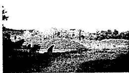
Necropoli della Banditaccia PATRIMONIO MONDIALE DELL' UMANITA'

----- P.zza Risorgimento n° 1 – 00052 Cerveteri (Roma) – tel. 06/896301 – fax 06/9943008 www.comune.cerveteri.rm.it